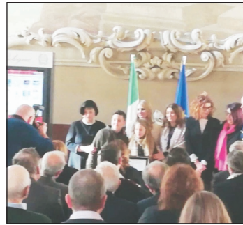
La consegna del Premio Grillo

CERIMONIA di premiazione dei lavori delle scuole secondarie di primo e secondo grado che hanno partecipato alla quarta edizione del concorso Premio Giovanni Grillo, promosso dall'omonima Fondazione, in collaborazione con il Miur e con il patrocinio morale e gratuito dell'Aeronautica Militare. Cerimonia che quest'anno si è