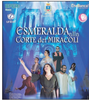
La locandina del musical