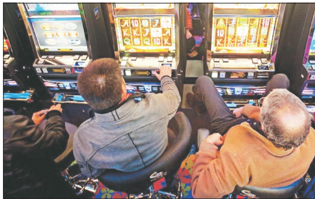
Giacatori ai videopoker